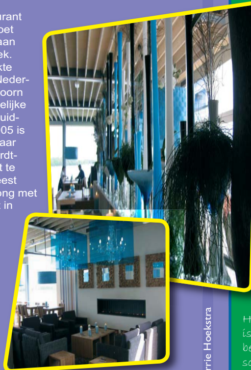
Tekst: Korrie Hoekstra

Meer informatie over Kaap Hoorn, oa. de menukaart, zaalverhuur en overige activiteiten, is te vinden op www.paviljoenkaaphoorn.nl . Goed om te weten: er is ook een kindermenukaart en een kinderspeelhoek met oa. spelcomputers. Een ontdekking die je liever niet doet, is dat er geen tafel vrij is. Reserveren is daarom aangeraden, zeker in het weekend.