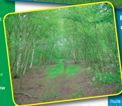
Het schiereiland van de Piccardthofplas is nog tamelijk onbekend.