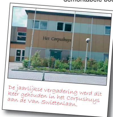
De jaarlijkse vergadering werd dit keer gehouden in het Corpushuys aan de van Swietenlaan.

laan een healing environment gecreëerd wordt waarbij o.a. elke afdeling een eigen kleur krijgt. Via zg. industriële en demontabele bouwtechnieken