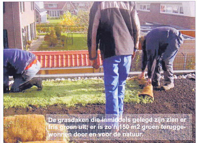
De grasdaken die inmiddels gelegd zijn zien er fris groen uit; er is zo'n 150 m2 groen teruggewonnen door en voor de natuur.

Onlangs zijn er in onze wijk een 7-tal platte daken door de firma Donker voorzien van een mos-sedum laag! Fris groen zien ze er nu uit; er is zo'n 150 m2 groen teruggewonnen door en voor de natuur. Het levert naast fraai uitzicht ook op dat de ruimtes onder deze daken nu geïsoleerd zijn; regenwater beter vasthouden en op de lange duur zijn de daken beter beschermd tegen vertering. Het resultaat is zodanig dat we volgend voorjaar opnieuw gezamenlijk (kosten drukkend) offertes zullen aanvragen. De gemeente heeft via LA21 [ www.LA21 groningen.nl ] als reactie laten weten bij een