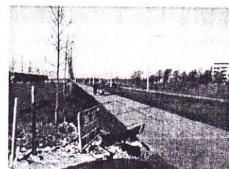
Ongelukken op de Van Swietenlaan

als het om snelheden gaat ook een taak bij de wijkbewoners. Automobilisten wordt dringend verzocht zich aan de 30 kilometer-snelheidslimiet te houden! Positief is dat er in het voorjaar een rotonde wordt aangelegd bij het ziekenhuis, zodat deze gevaarlijke situatie ten einde is. Eveneens gunstig is dat volgens de plannenmakers van Ter Borch er geen doorgaande weg voor automobilisten door de Piccardthof komt. De gemeente Groningen heeft zich in deze twee kwesties van zijn goede kant laten zien.