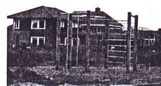
De eerste speeltoestellen