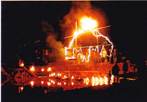
De climax van vuur!