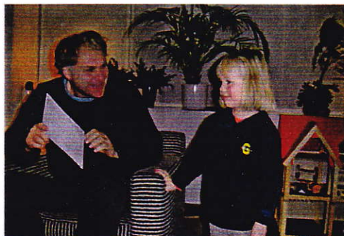
Astrid ontvangt haar prijs uit handen van de voorzitter van de vereniging

van het feest! Zo'n feest in twee etappes past gewoon bij de Piccardthof. Dat het zo'n succes was, is met name te danken aan de inzet van de feestcommissie en de sponsors. We hopen dat ook volgend jaar weer een groep bewoners enthousiast aan de slag gaat om een daverend feest te organiseren!